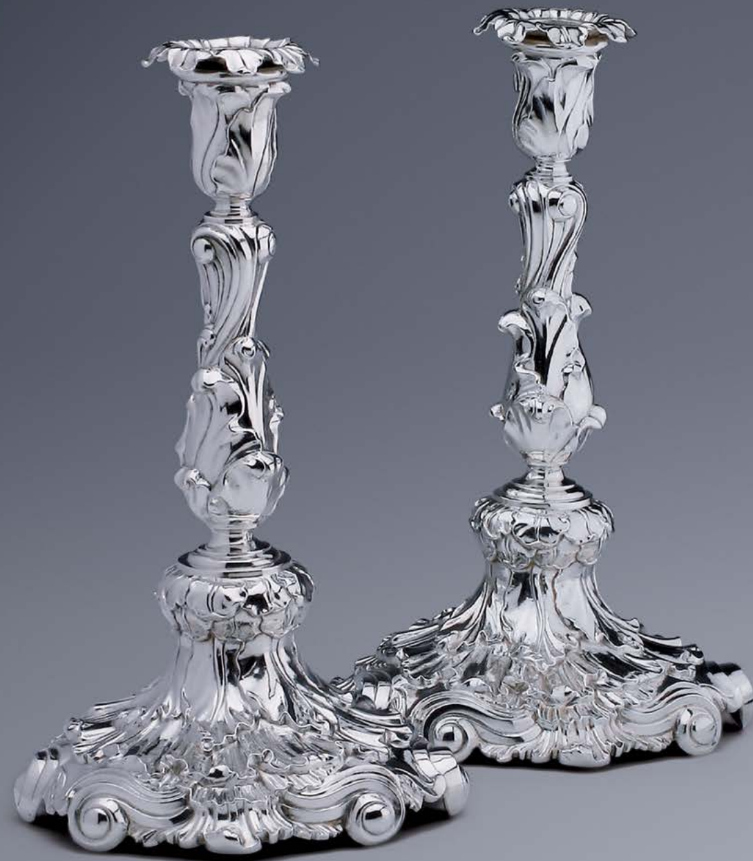
Een paar zilveren kandelaars door Hans Rinckens (Amsterdam, 1756). Hoogte 24,5 cm. gewicht 692 en 717 gr. Collectie A. Aardewerk Antiquair Juwelier, Den Haag.